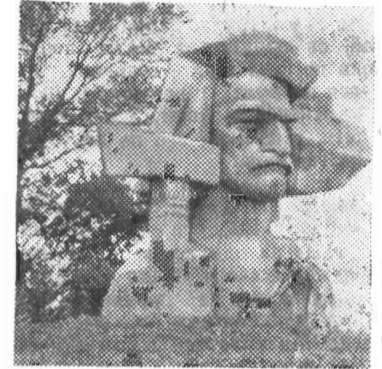
ИВАНО-ФРАНКОВСКАЯ ОБЛАСТЬ. В селе Печенежин Коломыйского района открыт историко-мемориальный музей и памятный знак народному кистелю, борцу против феодализма на Прикарпатье в XVIII веке.

чинают подозревать, доскать, захотелось отдохнуть, вот и едут. Повсюду с гордостью рассказывают о студентах-заочниках, будущих специалистах.