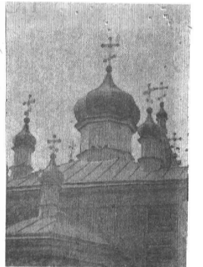
На снимках: церковь сегодня. Издалека видны ее семь глав с позолоченными крестами. Текст и фото Ю. КАРНАУХОВА.

месте стоит церковь. И этот кусочек старины нужно бы сохранить для людей. Церковь давно перестала быть местом отправления религиозного культа, но думается, что имеет право быть памятником русскому зодчеству, русским умельцам.