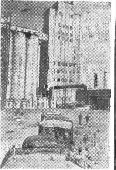
КЕМЕРОВСКАЯ ОБЛАСТЬ. Непрерывным потоком поступает зерно на Беловский хлебокомбинат (на снимке).

Как и теперь, через село тогда пролегал дорога из Щегловки к Печи на Поломошное и Томск. Места вокруг были дикие. Повсюду леса и только кое-где вахши.